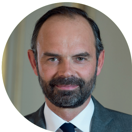
Edouard PHILIPPE Premier ministre