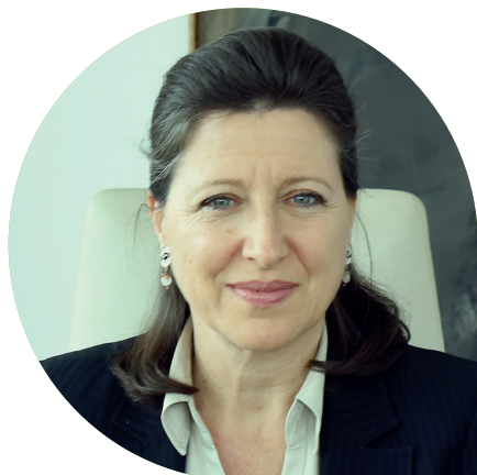
Agnès BUZYN Ministre des Solidarités et de la Santé